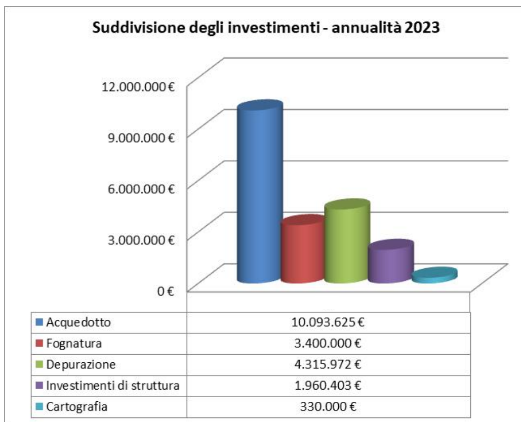
Graf 1.- Suddivisione degli investimenti per servizio

La suddivisione degli investimenti è riportata nei due grafici seguenti dai quali si evince che gli importi proposti ricalcano perfettamente gli investimenti previsti in Piano d'Ambito.