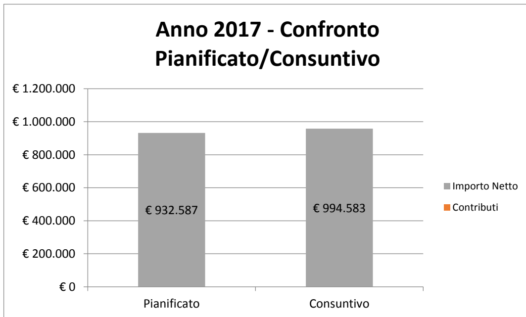
Fig.1 – Istogramma di confronto tra quanto pianificato e quanto rendicontato nel 2017