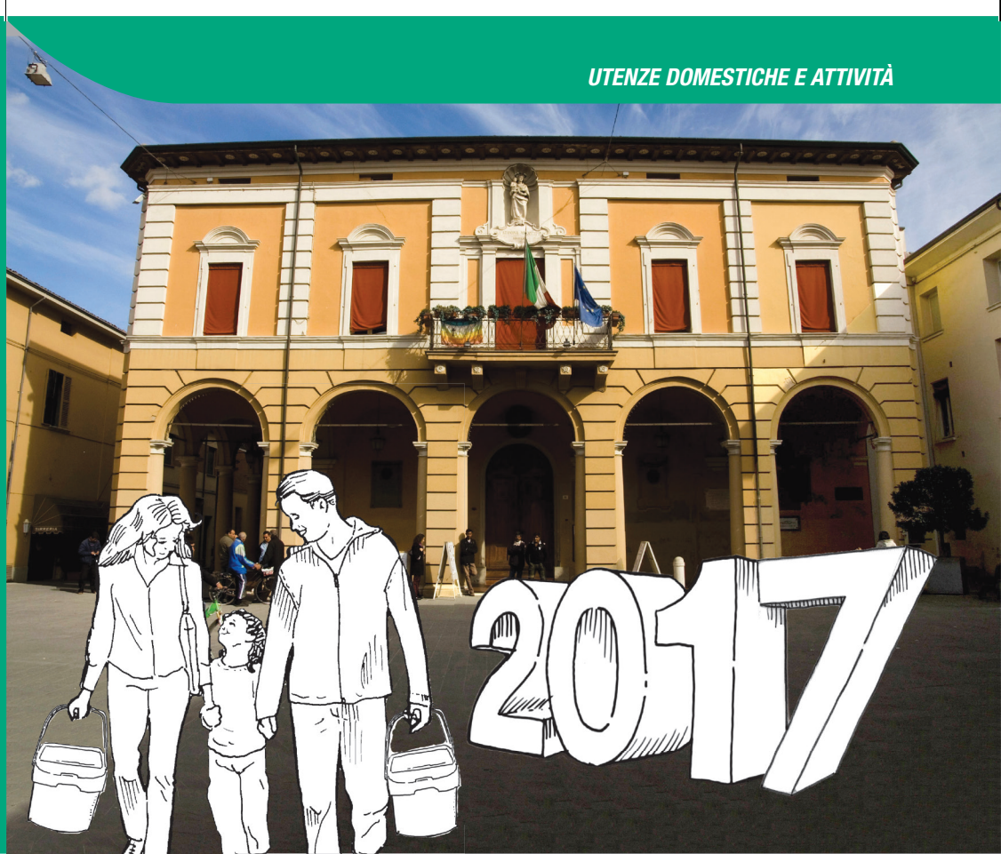
edizione Aprile 2017, stampato su carta ecologica - design: Koan multimedia